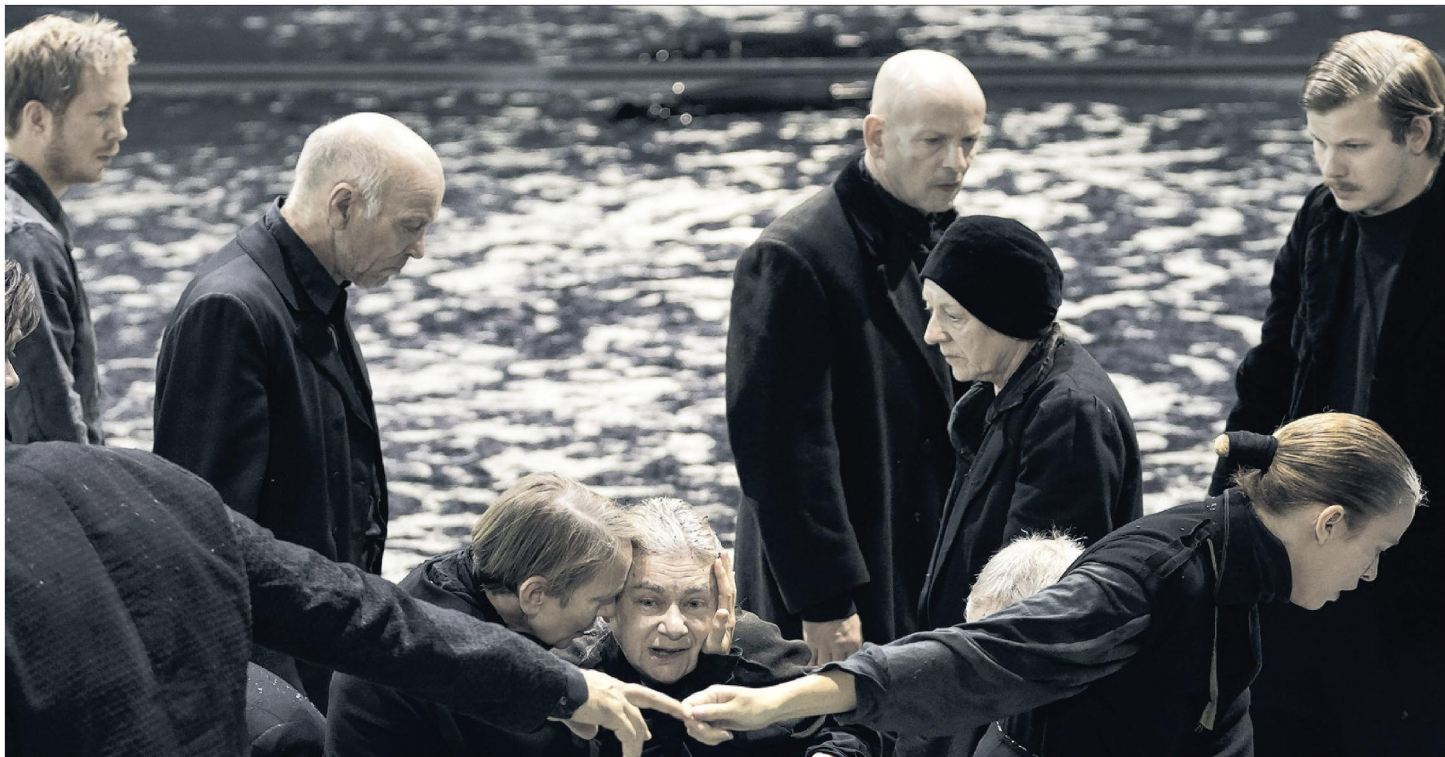
De dingen die voorbij- gaan door Toneelgroep Amsterdam en Toneel- huis Antwerpen.