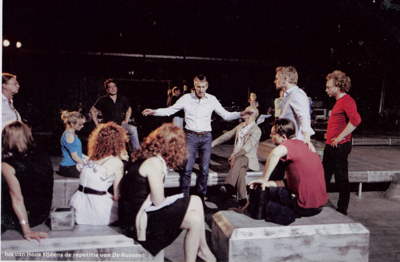
Ivo van Hove tijdens de repetitie van De Russen!

hooliganisme, outsider zijn, je positie moeten bevechten, insider worden...'