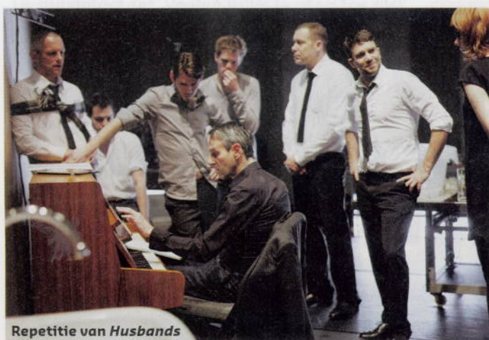
Repetitie van Husbands

'De limieten opzoeken. Ja, dat kun je alleen maar doen met fantastische acteurs en die fantastische acteurs heb ik. Kijk, Gijs Scholten van Aschat, Kitty Courbois, Chris Nietvelt, Hans Kesting, Halina Reijn, Karina Smulders... noem ze allemaal maar op, die kunnen ook heel goed spelen zonder mij. En toch, de blik en