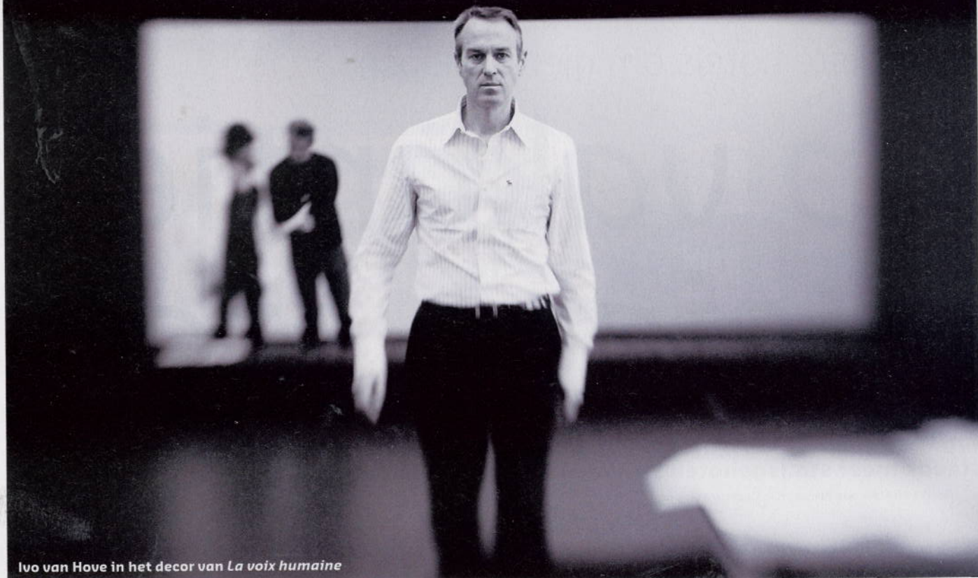
Ivo van Hove in het decor van La voix humaine