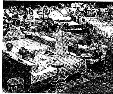
Szene aus „Faces“, das Hove 2005 inszenierte

■ Van Hove wurde 1958 in Belgien geboren. Als Direktor leitete er von 1990 bis 2000 die Thea-