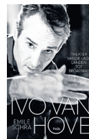
Ivo van Hove: Theater van de Lage Landen tot Broadway van Emile Schra, uitgeverij Polis, 256 blz., €22,50 euro. Vanaf dinsdag in de boekhandel.

Verder geen ander rekvisitair dan een infuus op wielen. Telefoonspreekten worden gevoerd door duim en pink tegen de zijkant van het hoofd te houden. En de door kenners beoordeelde spektakelscène met de luidruchtige binnenkomst van die engel dwars door het plafond? Dat wordt bij TA gewoon een man in een witte jas die in een verzegend wit licht een-