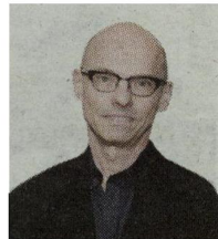
Jan Versweyveld Foto Getty

Versweyveld had eerst niet veel op met camp, al is hij wel liefhebber van 'haute couture'. Maar toen hij zich verdiepte in Sontags essay, groeide het respect. 'Zij schrijft geestig en scherpzinnig over camp – in wezen een com-