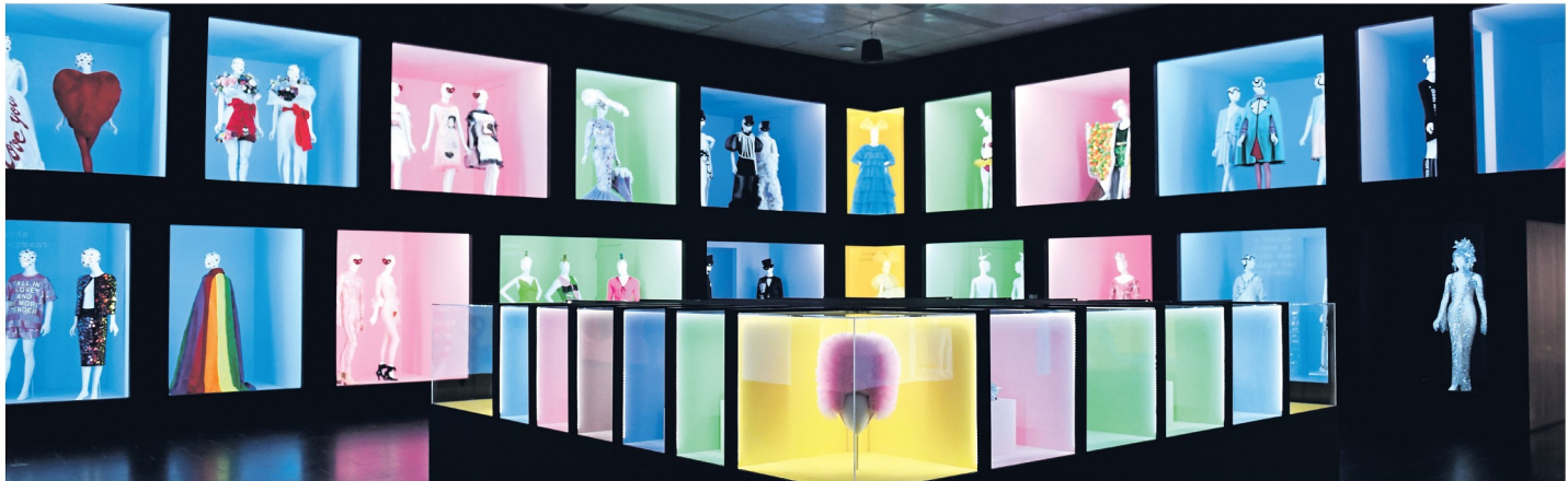
Gallery View, Part 2.