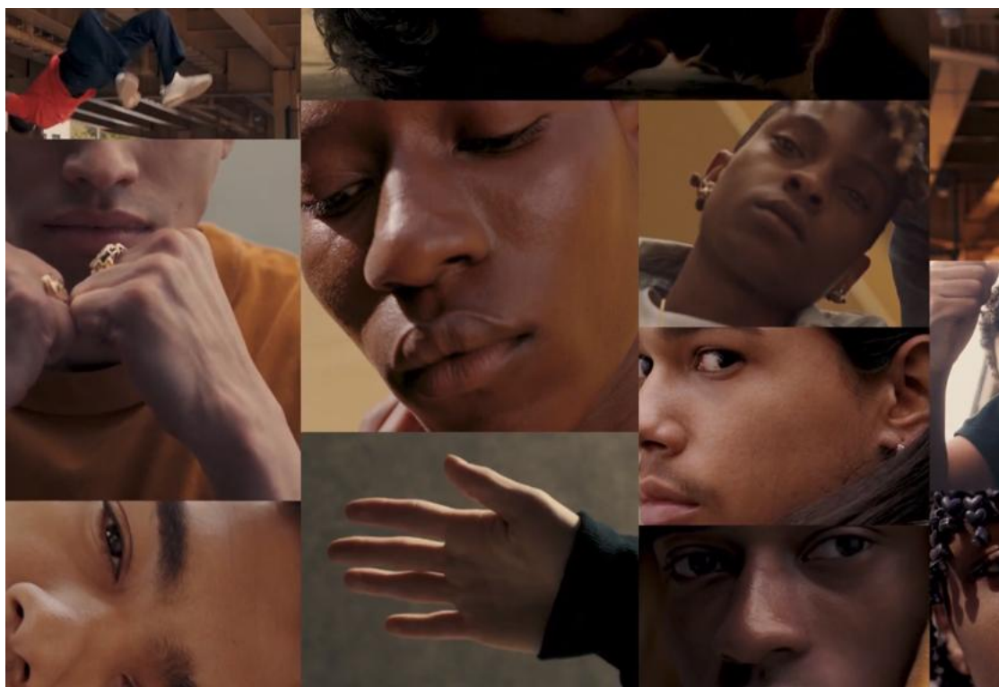
Promobeeld voor de remake van West Side Story.

Wie? Regisseur en choreografe Wat? De subsidies geven jonge kunstenaars een zetje, maar zijn ook noodzakelijk voor artiesten die geen aanspraak willen maken op permanente structurele ondersteuning.