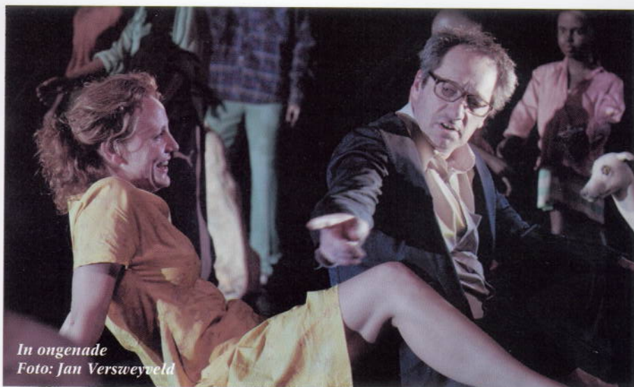
In ongenade

Ik heb helemaal geen conclusie over deze eneroverende en aangrijpende Europese voorstelling over een Afrikaanse wereld. We zien Coetzee's visie, zorgvuldig verwoord en uitgebeeld. We zien mogelijkheden, niemand wordt veroordeeld. Behalve de arme David Lurie, die in die maatschappij geen plek meer kan vinden, net als de schrijver van In ongenade , die intussen Australisch staatsburger is