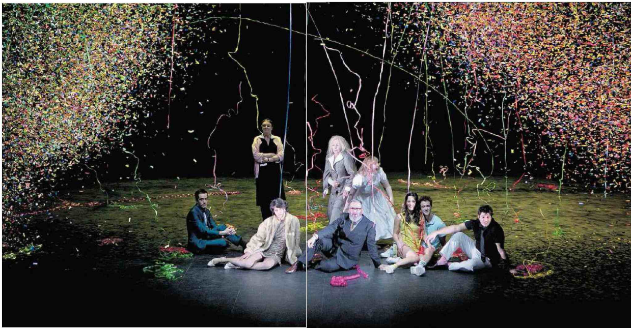
De klassieke komedie Tartuffe door Toneelgroep Amsterdam en NTGent.

• Omdat de theatercensuur in de DDR vervolgens zeer verhardde keerde Gotscheff terug naar Bulgarije om daar zijn geluk te beproeven. Maar ook in Bulgarije werd regime-kritische kunst door de autoriteiten niet op prijs gesteld, en nadat hem het werken was verboden emigreerde hij in 1985 uit het Oostblok om in West-Duitsland te gaan werken.