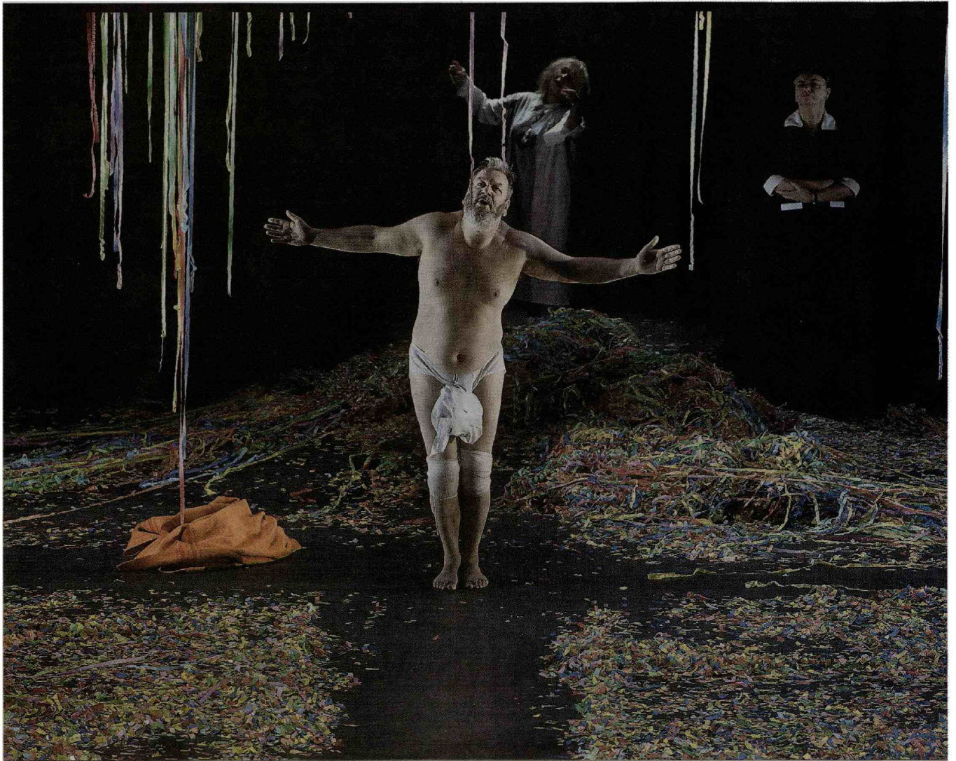
Wim Opbrouck als Orgon in 'Tartuffe'.