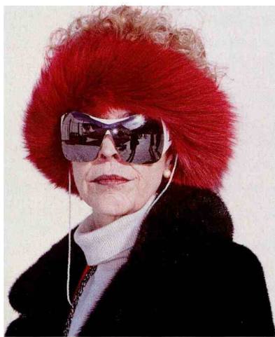
'Dit is een leuk, een beetje gruwelijk portret'