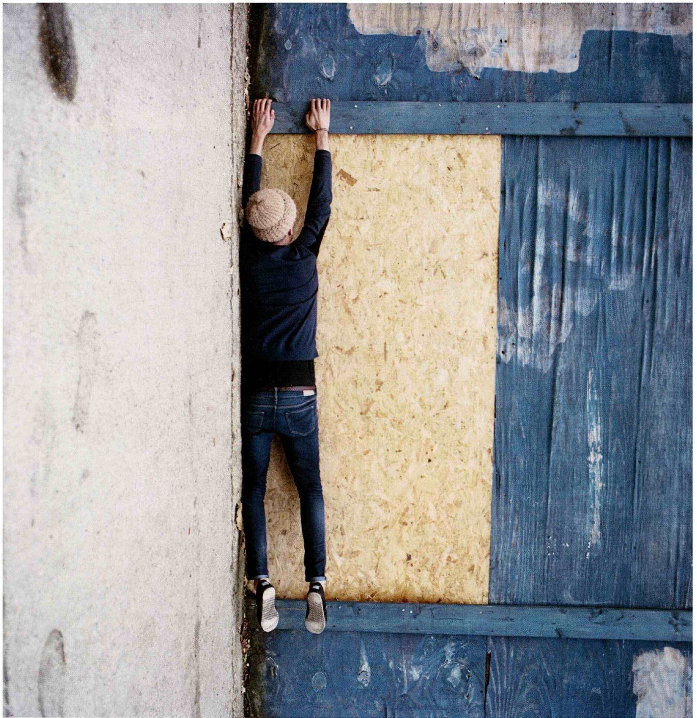
Kemna: 'Ik ken zowel de fotograaf – Raven Smith – als de galerie – Flowers Gallery – niet. Maar deze foto intrigeert me zeer'