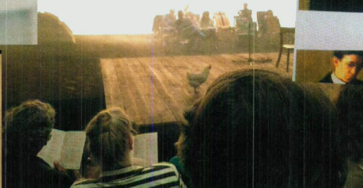
Falen, het nieuwe succes