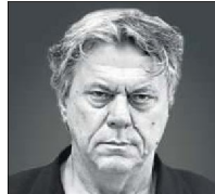
Johan Simons is regisseur, intendant van de Münchner Kammerspiele en lid van de Akademie van Kunsten.

Kunst is cruciaal: ze spoort aan tot fantasie en reflectie, ze biedt denkmodellen voor de toekomst en graaft daartoe diep in waardevolle herinneringen en erfenissen uit het verleden, zoals het spaarzaam nagelaten werk van Georg Büchner, het wonderkind dat over het slechte in de mens en over de humanistische revolutie schreef.