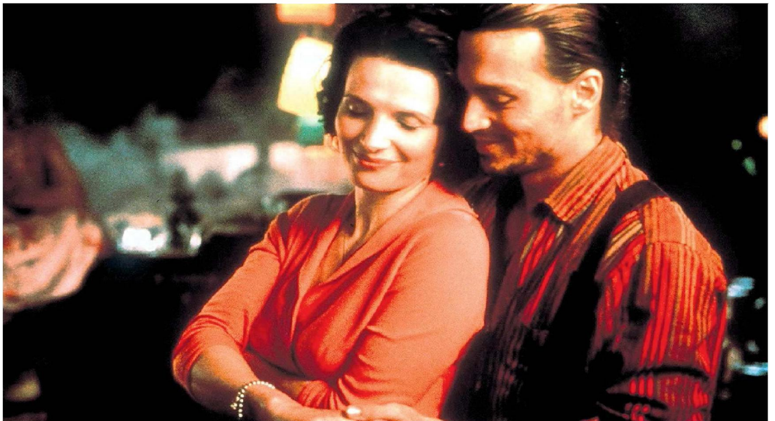
Juliette Binoche in drie van haar bekendste films. Vanaf boven: The Unbearable Lightness of Being (1988), Trois Couleurs: Blue (1993), Chocolat (2000).