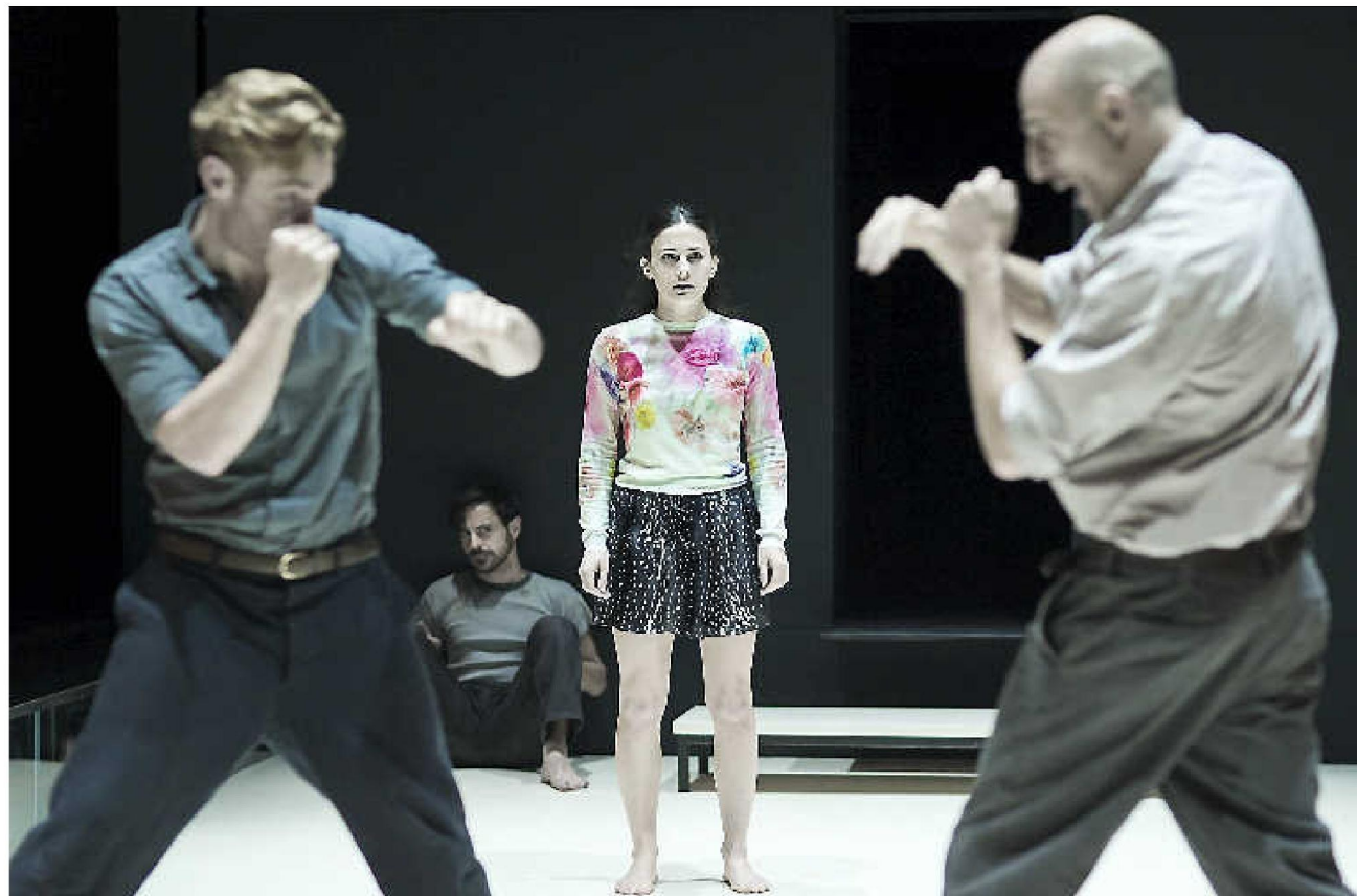
Bij 'A view from the bridge' paste de decorontwerper totale kaalslag toe.