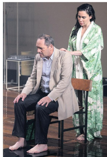
▲ Scholten van Aschat op het podium met tegenspeelster Halina Reijn.

Gijs Scholten van Aschat merkt al dat hij status krijgt van ‘acteur op zekere leeftijd’