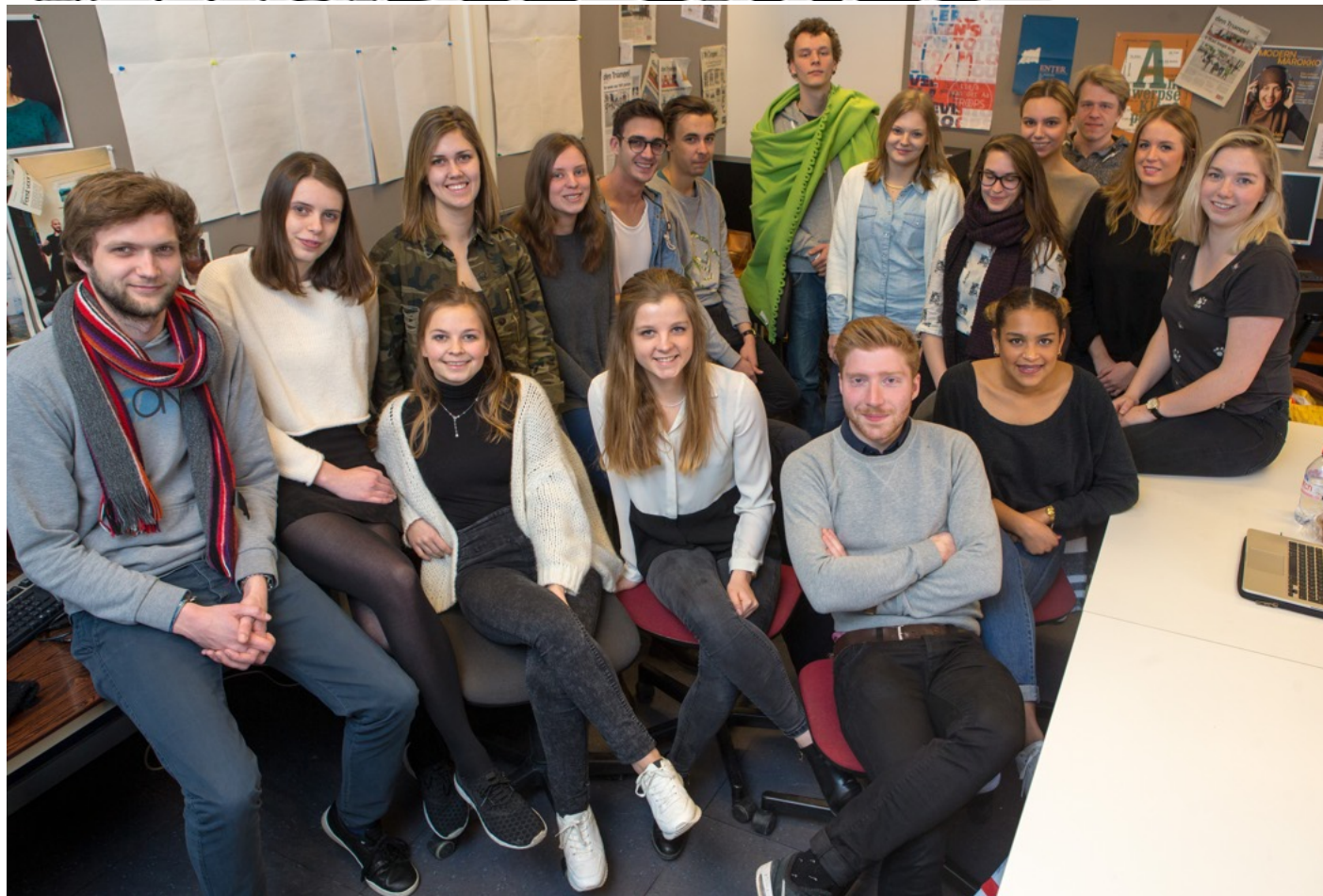
De studenten journalistiek van de AP Hogeschool die meewerkten aan de reeks Invisible Cities.