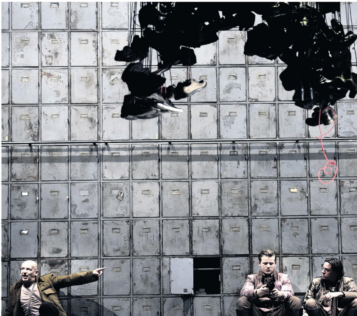
'De welwillenden', met een achterwand die gevormd wordt door dossierkasten.