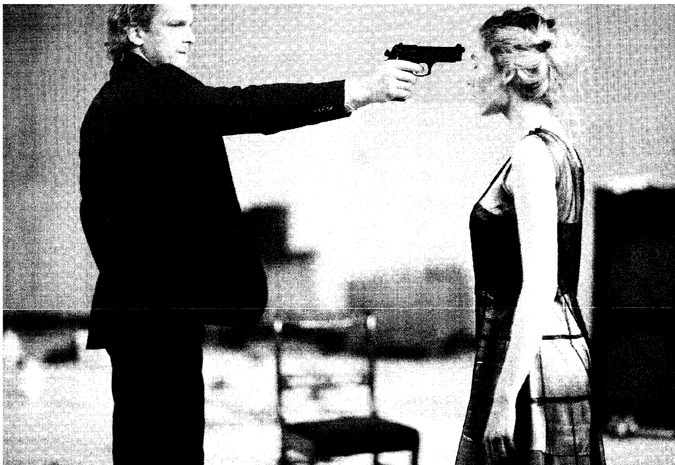
Halina Reijn in de nieuwe Hedda Gabler van Toneelgroep Amsterdam. Links Barry Atsma.