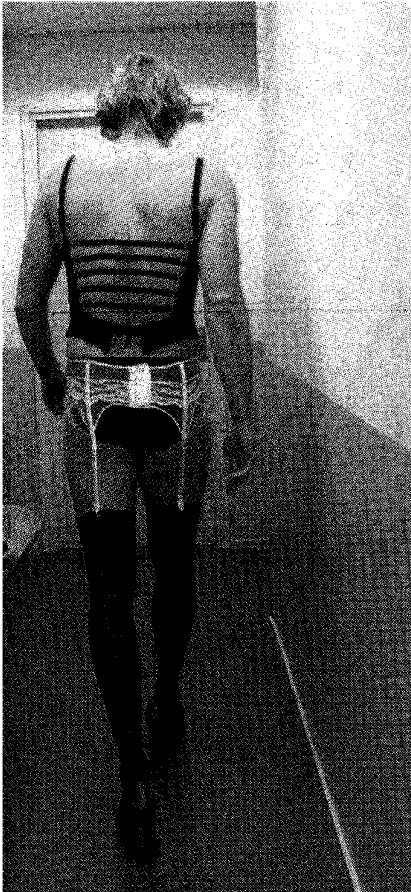
En als Madame de Sade.