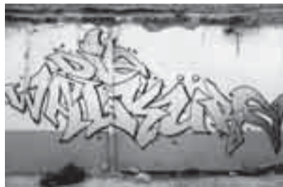
„Die Walküre” in graffiti.

„Het doet recht aan de dramaturgie van Wagner. De ring rammelt niet, zoals men wel eens beweert. De cyclus is fragmentarisch opgebouwd. Je ziet heel verschillende werelden.