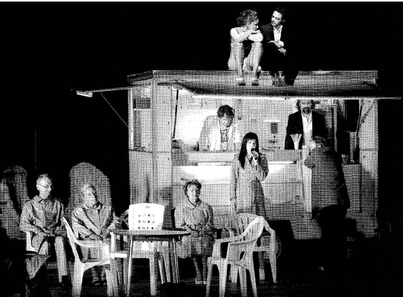
Acteurs en figuranten bij de frietkraam tijdens de repetities voor Hemel boven Berlijn .