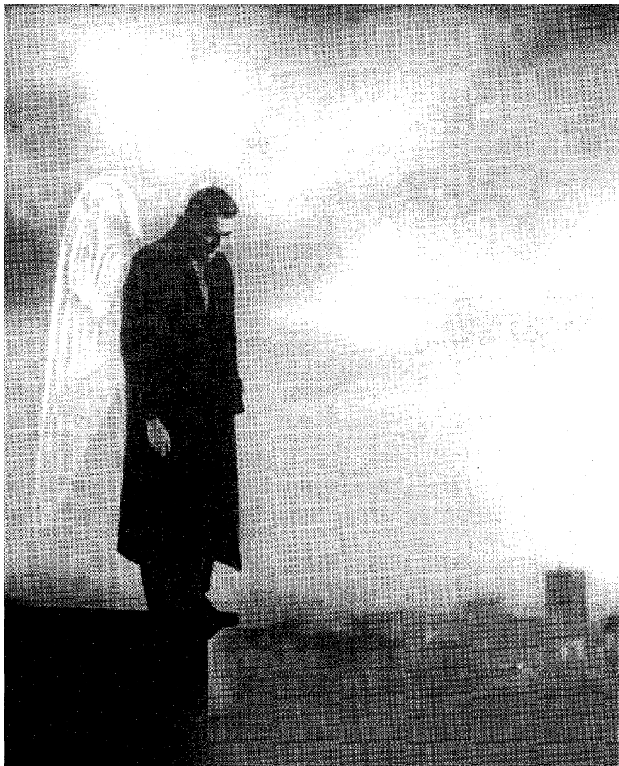
Bruno Ganz als engel in 'Der Himmel über Berlin', een film uit 1987 van regisseur Wim Wenders

Het toneelstuk ‘Angels in America’ van Tony Kushner in de voorstelling van Toneelgroep Amsterdam onder regie van Ivo van Hove is dit seizoen nog tot eind mei in Nederland te zien.