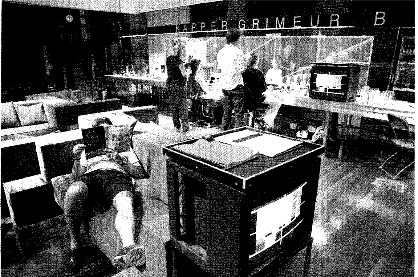
De kleedkamer op het toneel.