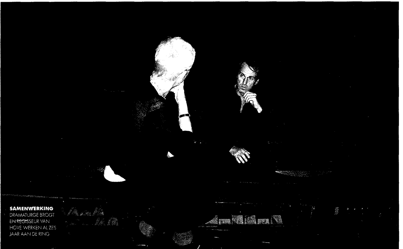
SAMENWERKING DRAMATURGE BROGT EN REGISSEUR VAN HOVE WERKEN AL ZES JAAR AAN DE RING