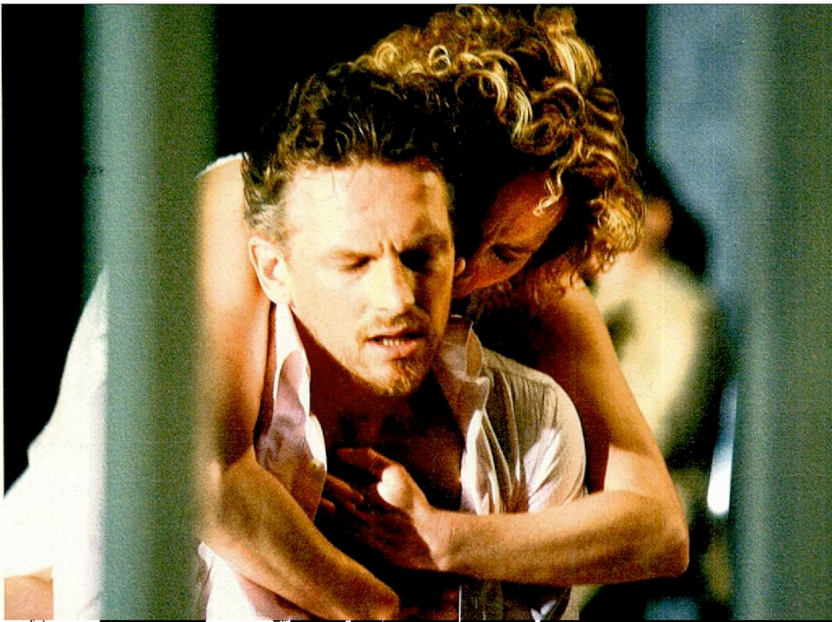
Barry Atsma speelt Oedipous in Delpeuts razendsnelle bewerking