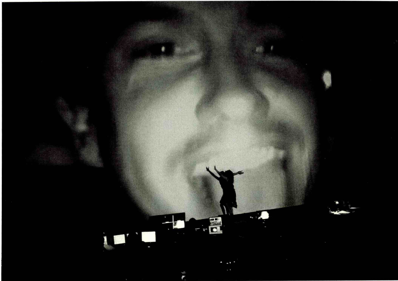
SPELERS BLIJVEN OVEREIND ONDANKS DE REUSACHTIGE SCHERMEN ACHTER HEN

Antonioni Project: van 11 t/m 20 juni in de Stadschouwburg Amsterdam, première op 14 juni, www.toneelgroepamsterdam.nl