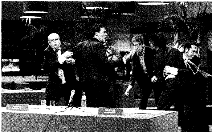
Beeld uit Romeinse Tragedies van Ivo van Hove.