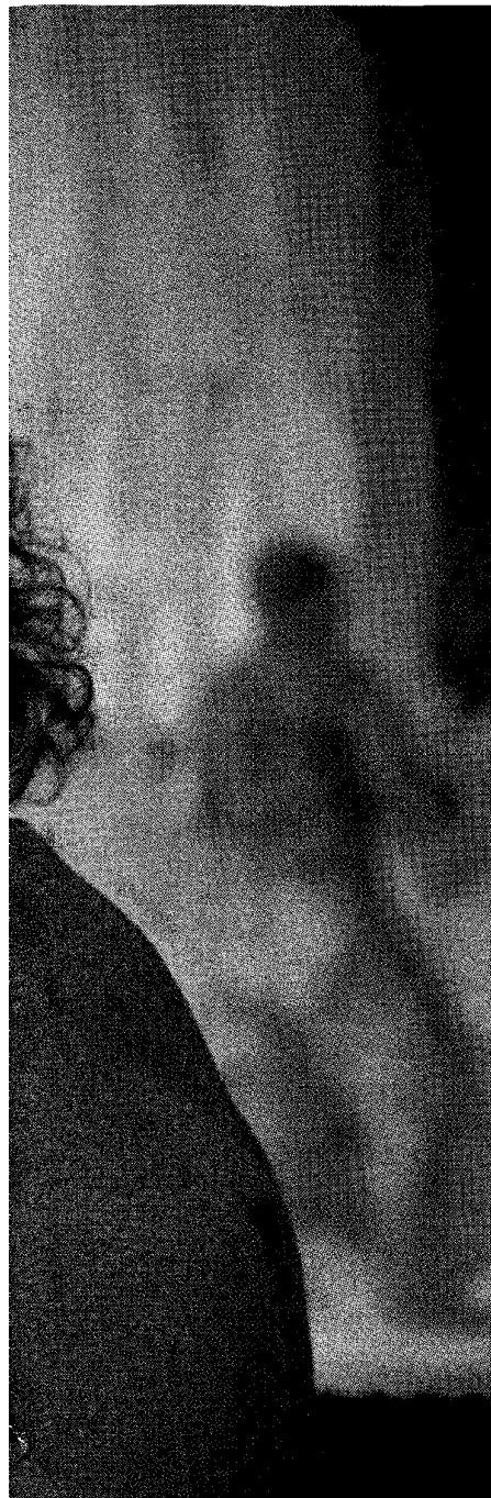
familieverhaal van gemaakt.'