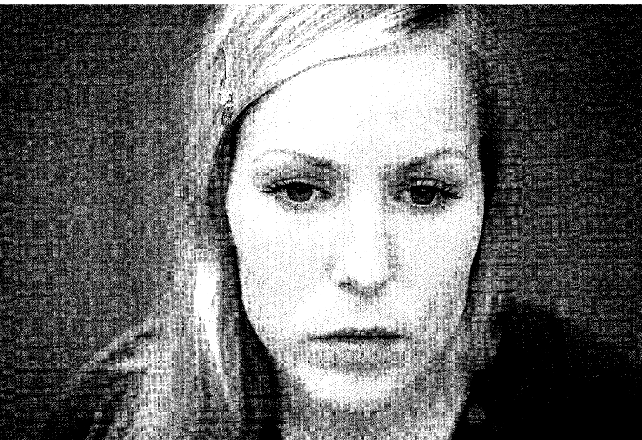
actrice en zangeres Hadewych Minis: 'Ik ben iemand die altijd veel van zichzelf moet.'