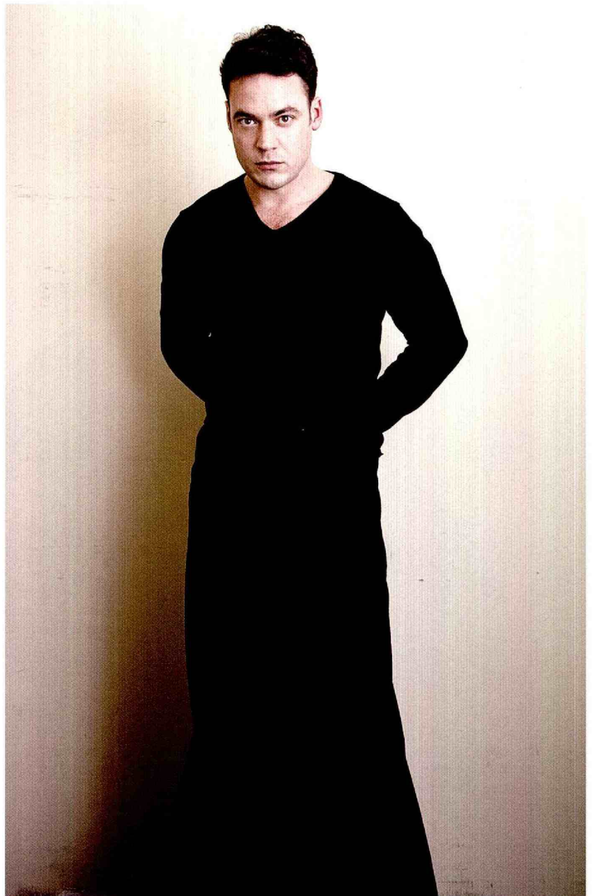
VER WEG VAN THE HULK 'GELOOF ME, HET IS LANG NIET ALTIJD PRETTIG OP TONEEL'

Meer informatie over 'Rocco en zijn broers' en 'Het Antonioni project' door Toneelgroep Amsterdam: www.toneelgroepamsterdam.nl